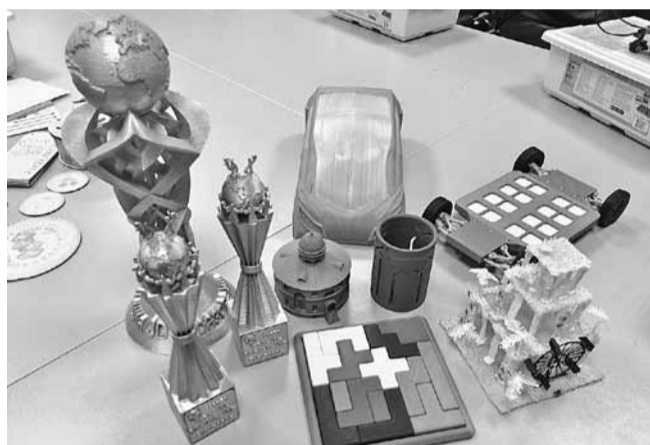
Чего только школьники уже не успели напечатать на 3D-принтере: головоломки, кубки, медали, макет Круглого здания...