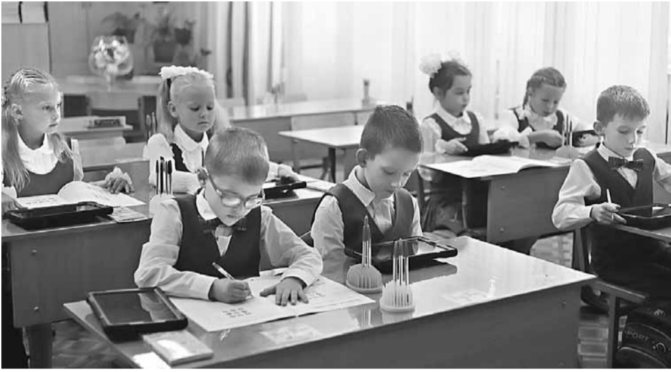
1 «Е» класс на внеурочном занятии «Информатика на платформе «Алгоритмика»