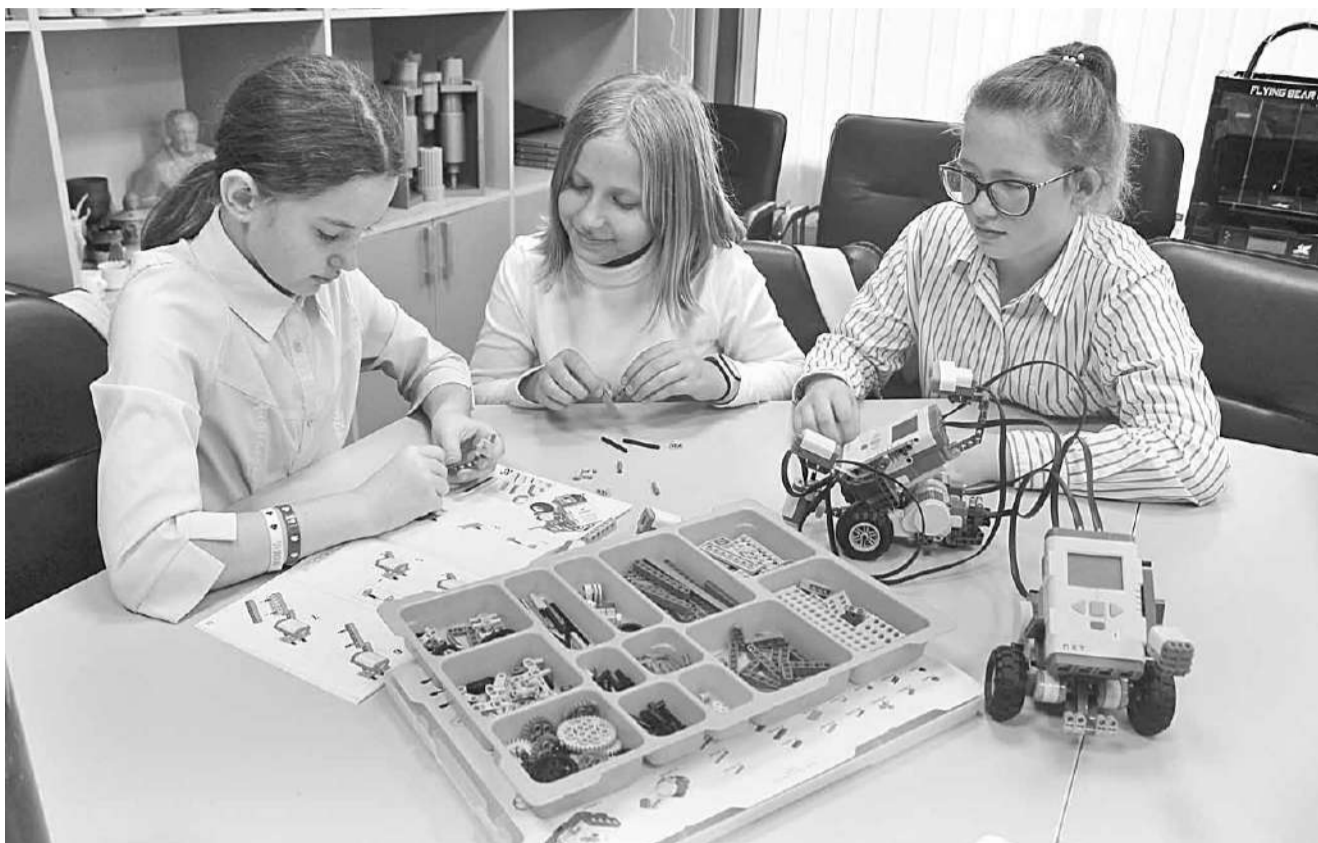
«Робототехника» интересна не только мальчишкам

2016 год. Первые шаги сделаны. Но кого, как говорится, поставить у 3D-руля? Директора? Конечно, не поспоришь, отличный организатор, но острее стоит кадровый вопрос. Это сегодня педа-