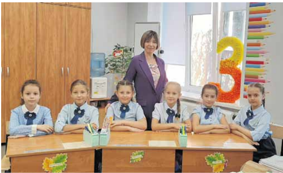
Творческие третьеклассницы — ансамбль жестовой песни «Очаровашки»