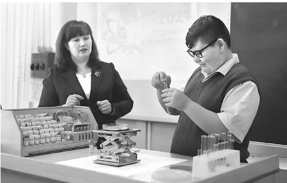
На классном часе «Химический эксперимент и его роль в развитии науки» в 7 «В» классе