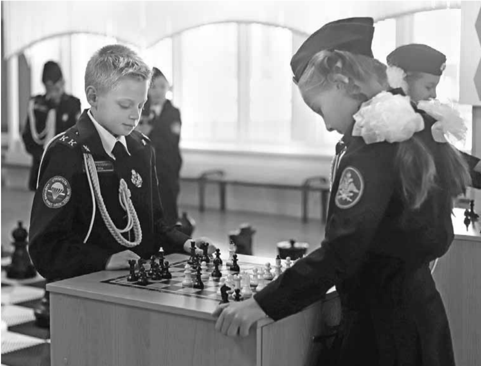
В 4 «В» классе благодаря реализации проекта «Шахматы для всех» все ребята научились играть в шахматы