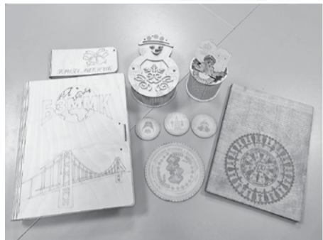
Сувенирная продукция, которую сделали в Головчинской школе