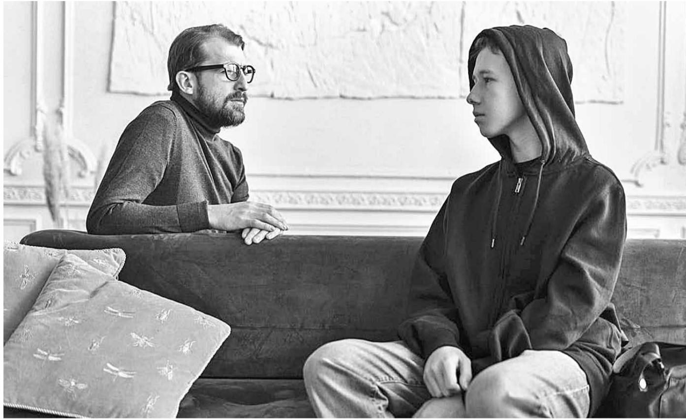
Для подростка очень важно знать, что родители его любят и понимают

ПОЧЕМУ В КАЖДОЙ ШКОЛЕ ДОЛЖНО БЫТЬ ОРГАНИЗОВАНО ПСИХОЛОГО-ПЕДАГОГИЧЕСКОЕ СОПРОВОЖДЕНИЕ