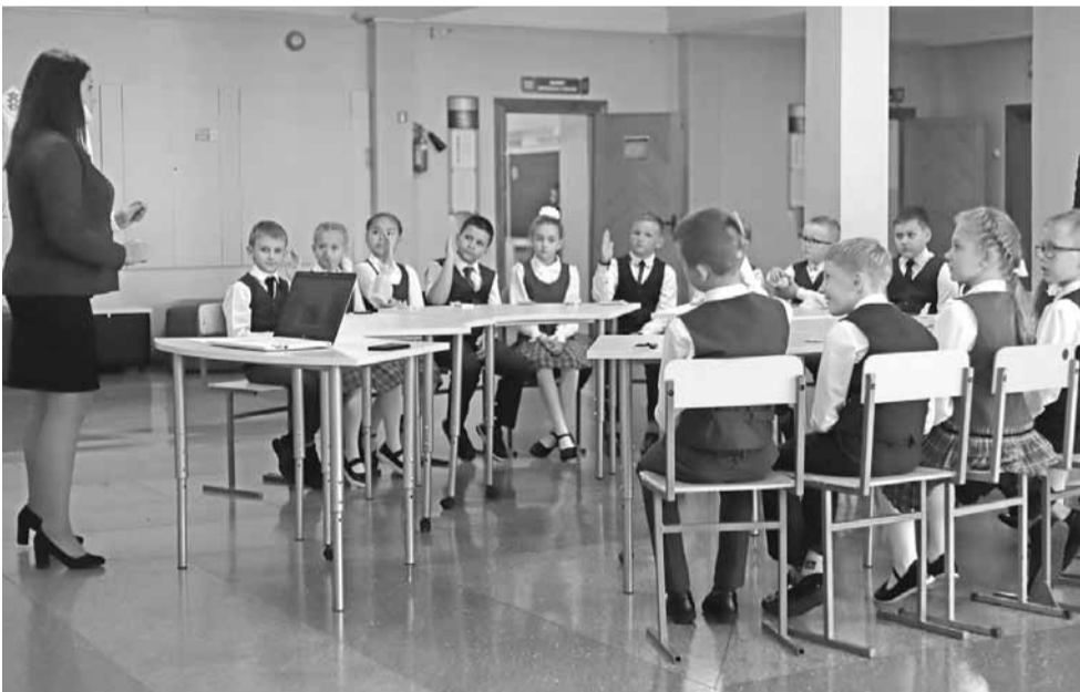
Многие уроки и внеурочные занятия в школе №3 проводят в просторных рекреациях