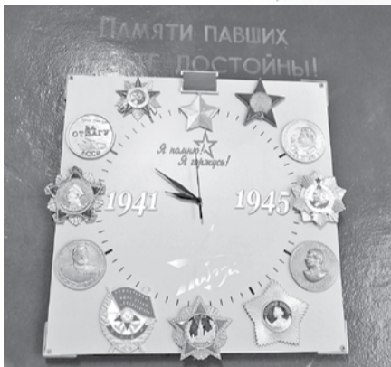
И даже школьные настенные часы сделали с помощью 3D-технологий

15 3D-принтеров, два 3D-сканера, станок лазерной резки, фрезерный станок, четыре квадрокоптера, два комплекта очков виртуальной реальности, ноутбук, 3D-ручки... Откуда в сельской Головчинской школе столько современной техники? В 2019 году открыли «Точку роста». Но это лишь только 3D-оборудования. А остальное?