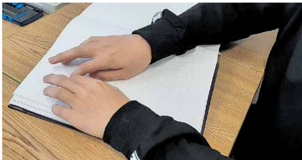
Чтение книги по азбуке Брайля

Сотрудничество с библиотекой удобнее и потому, что невостребованные учебники можно сдать обратно в книжные фонды, пока не появятся ребята, которым эти пособия необходимы, ведь в школе-интернате просто нет места, чтобы хранить много громоздких томов. Иногда присылают учебную литературу во временное пользование из московских издательств или Валуйской школы-интерната для слепых. Или наоборот, в Валуйки едут учебники из Белгорода. Такой взаимобмен выгоден всем. А чтобы ученики не носили тяжёлые портфели, в школе-интернате стараются добыть по два экземпляра учебной литературы — с одним дети занимаются в школе, с другим — дома.