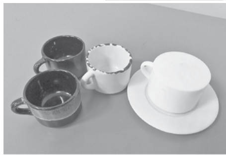
Головчинские школьники разработали мастер-модель кофейной пары для Борисовской фабрики керамики